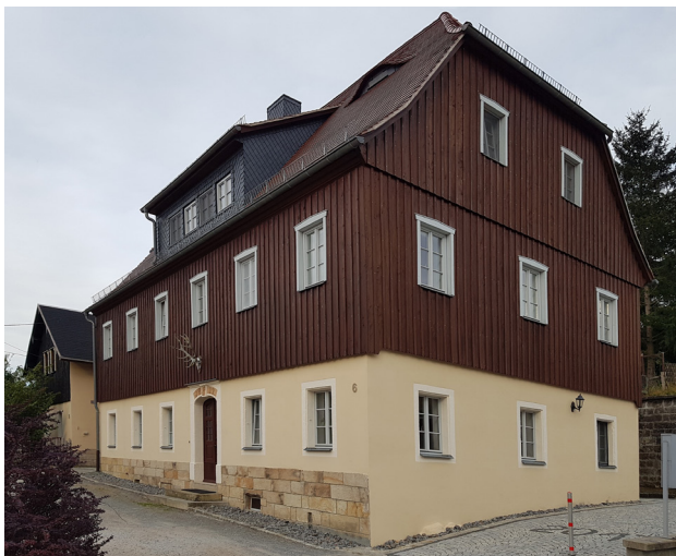
Abb. 3: Das Ottendorfer Forsthaus

Etwa 1927 gab es (SHB 1927 [S. 225] S. 203) eine Forst-Umstrukturierung. Die alten (revierleitenden) Oberförstereien wurden größeren, neu geschaffenen Forstämtern unterstellt. Die Ottendorfer Oberförsterei wurde dem Forstamt Hinterhermsdorf unterstellt und verbleibt nur noch als Forstwartei. Die Forstreviere Mittelndorf und Postelwitz erscheinen im Messtischblatt nun zu einem Forstrevier Bad Schandau vereinigt. Das dortige Forsthaus an der Lindenallee in Bad Schandau (heute Nationalparkverwaltung) ist das Forstamt.