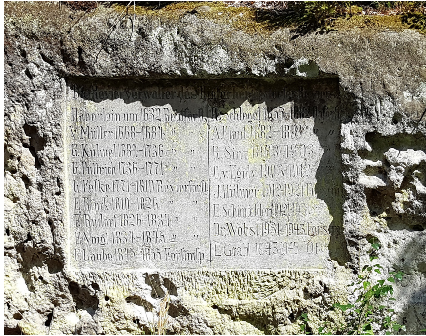
Abb. 1: Inschriften auf dem Altarstein

Der Forst untersteht gemeinsam mit Zoll, Bergbau und der Eisenbahn dem Finanzministerium. Die Sächsischen Forsten gliederten sich in zehn von I. bis X. durchnummerierte Forstbezirke. Die rechtselfische Sächsische Schweiz bildeten den Forstbezirk III. (Schandau). Dieser wiederum