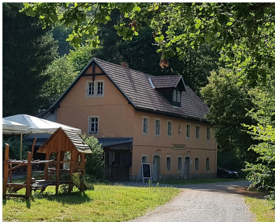
Abb. 4: Altes Zeughaus

Vielfach haben sich die Namen der Förster und Waldarbeiter als Orts- und Flurnamen erhalten: Puttrichberg, Wagners Ruh, Tägers Wonne, möglich auch, dass die Hilleschlüchte auf Fußknecht Hille von 1602 zurückgehen. Das Bild vom altergrauten Oberförster, der nach jahrzehntelangem Dienst jeden Baum und Wildschützen kannte (allwöchentlich bei Bier und Skat in Zeughaus oder Buschmühle zechend), muss allerdings ins Reich der Legende verwiesen werden. Meist waren die Revierleiter nur wenige Jahre hier. Hermann Täger, der Erbauer des Bußbergweges, erscheint erstmalig 1867, am 27.12.1873 hat er seinen Ausstand im Gasthof Hertigswalde gegeben, weiterer Dienst in Schwarzen-